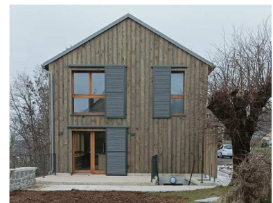
Aménagement d'un gîte communal à Drugeac (maîtrise d'œuvre : Atelier Cyril VIDAL / Germain BRUNET / Eric LANGLAMET / IGETEC)