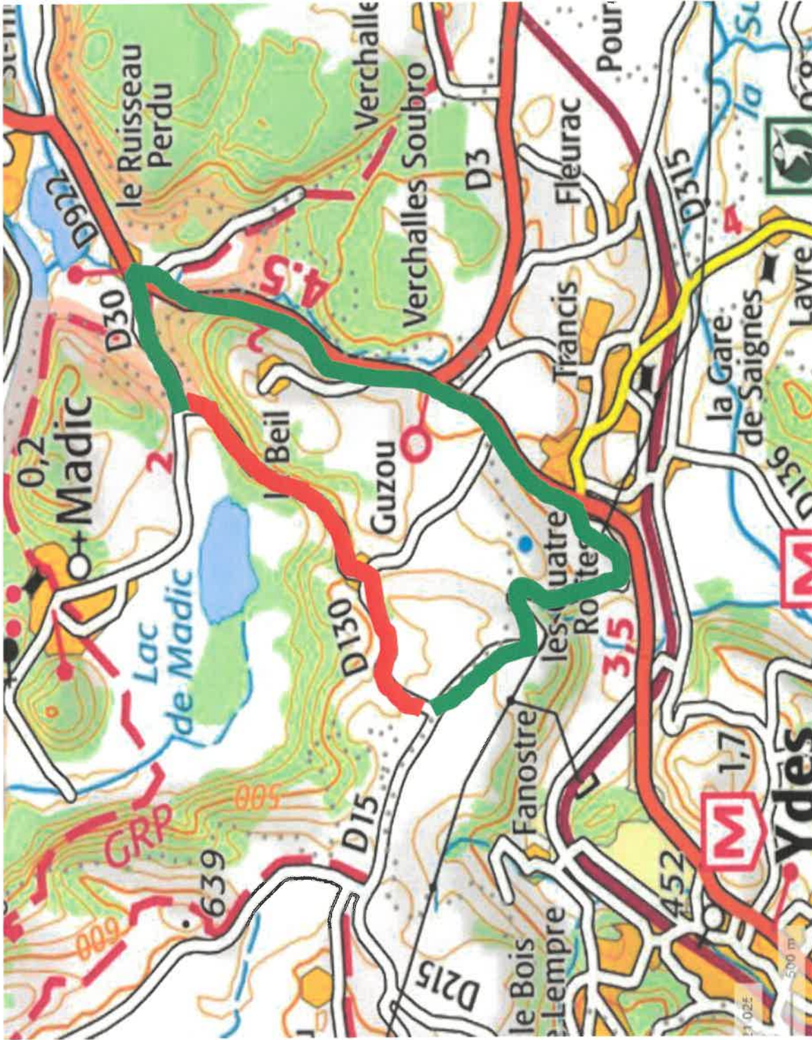
RD 130 fermée en totalité Déviation par les RD 15, 922 et 430 via la Baraque et le Ruisseau Perdu